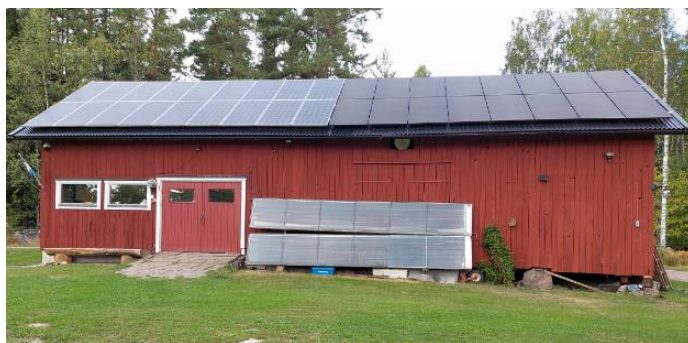
5,5 + 6,5 kW solceller på taket ger el och 11 m 2 solfångare mot väggen värmer verkstaden

Vi träffas i all enkelhet och får höra lite om anläggningen och delar med oss av frågor och erfarenheter. Karl-Olov tillhör veteranerna i Energiföreningen och har allehanda andra roliga projekt.