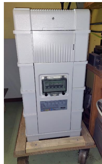
Batterilager 12 kWh står i verkstaden. Kan enkelt utökas på höjden.